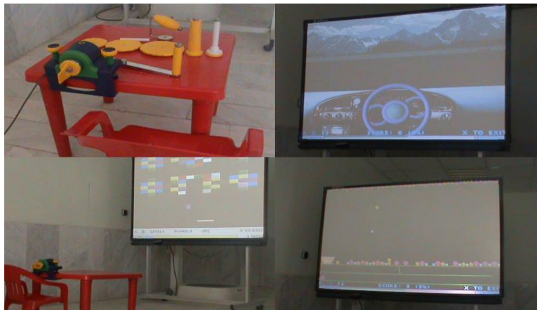
شکل ۱- سیستم واقعیت مجازی E-Link

افزایش دهد و هم کودک را نسبت به نحوه فعالیت خود آگاه سازد. برنامه تمرینی نیز به صورت روزانه ۱/۵ ساعت و یک روز در میان در مدت ۴ هفته بود و در صورت وجود زمان استراحت حین جلسه درمانی، تمرینات تا تکمیل یک ساعت و نیم تمرین ادامه پیدا می‌کردند.