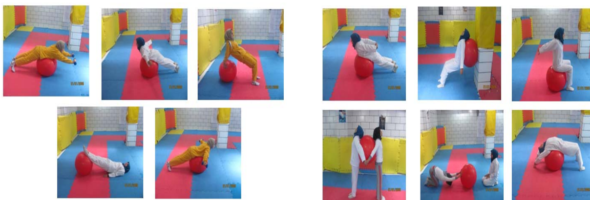
شکل ۱- نمونه ای از تمرینات کششی با استفاده از فیزیوبال / شکل ۲- نمونه ای از تمرینات قدرتی با استفاده از فیزیوبال

سینه بالا می آمد. سپس با استفاده از دمبل تمرین انجام می شد که به این ترتیب با بزرگتر کردن بازوی گشتاور تمرین را سنگین تر می کرد. با افزایش تعداد تکرارها و یا افزایش وزن دمبل میزان بار افزایش یافت. این برنامه بصورت کاملاً کنترل شده و زیر نظر مربی انجام گرفت. برنامه تمرینی گروه تجربی دو شامل برنامه های درمانی متداول و رایجی بود که این تمرینات از دو گروه تمرینات کششی و تقویتی تشکیل شده بود که شامل تمرینات انعطاف پذیری عضلات قدامی و جانبی ناحیه قفسه سینه و برنامه های تقویتی عضلات نزدیک کننده و راست کننده ستون فقرات ناحیه پستی بود. در ابتدای هر جلسه