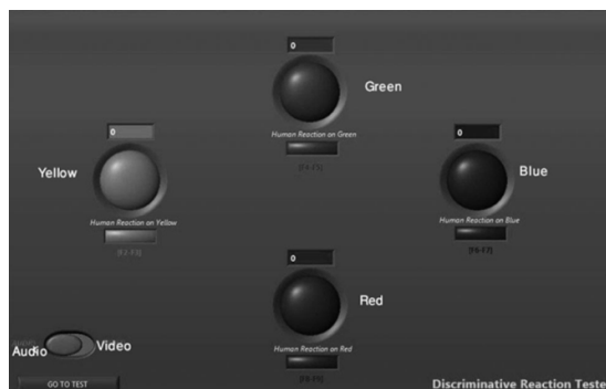
شکل 2- تصویر چهار دایره ی رنگی برای تست های زمان عکس‌العمل بینایی و شنوایی

چنانچه در منوی اولیه آزمونگر آزمون زمان عکس‌العمل را انتخاب می‌نمود، نرم افزار پنجره تست زمان عکس‌العمل را باز می‌کرد. در این بخش امکان ایجاد تحریک بینایی توسط روشن