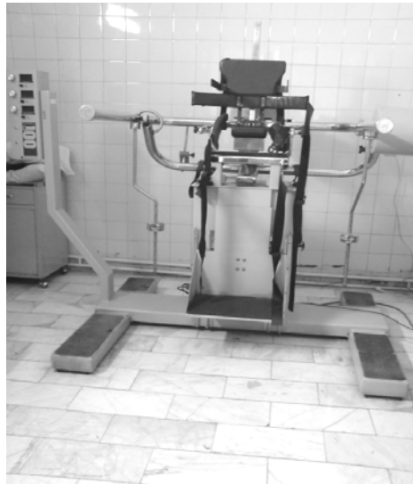
شکل ۱ - دستگاه ایزواستیشن B200

می‌شود. این دینامومتر سه محوری می‌تواند به طور همزمان شاخص‌های اصلی حرکت یعنی وضعیت زاویه‌ای، سرعت زاویه‌ای و گشتاور را در سه محور عمده حرکتی کمر (فرونال، ساجیتال، ترانسورس) و از طریق نه کانال محاسبه کند. از روی این شاخص‌ها پارامترهای دیگری همچون دامنه حرکتی، حداکثر و متوسط گشتاور و سرعت که برای ارزیابی دقیق حرکات ضروری اند ثبت می‌شوند (۱۱). در شروع آزمایش، فرد با پروتکل آزمایش آشنا می‌شد.